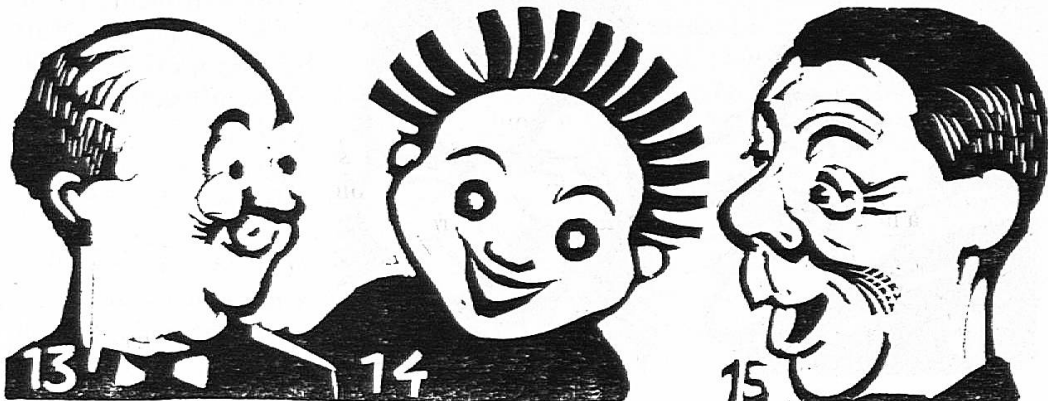
L'étonnement joyeux : Figures tirées de réclames commerciales ou cinématographiques.

Examinez les fig. 13, 14 et 15. Vous constaterez qu'elles rient puisque les coins de la bouche sont tirés vers les oreilles, et cependant les yeux ne sont pas à