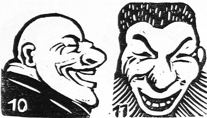
Le rire : La fig. 10 est tirée d'un journal anglais, la fig. 11 d'un journal chinois.

C'est par analogie avec l'homme que les dessinateurs font exprimer aux animaux des émotions diverses, qu'ils les font rire ou pleurer. Le procédé n'est pas difficile à appliquer quand on