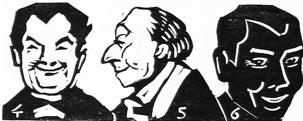
Le sourire : Le grand zygomatique en se contractant tire les coins de la bouche vers les oreilles. Les joues deviennent saillantes.

Le maître se procure si possible un crâne pour y montrer les pommettes , l'os frontal et les cavités de l'œil dont il va être question dans notre exposé.