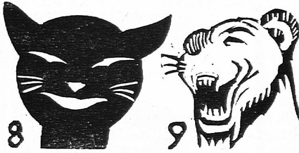
Le rire chez les animaux : Gueule fendue vers les oreilles ; yeux presque fermés.

masque de félin, Rabier a simplement fendu la bouche vers l'oreille et fermé l'œil ; et cela a suffi (fig. 9).