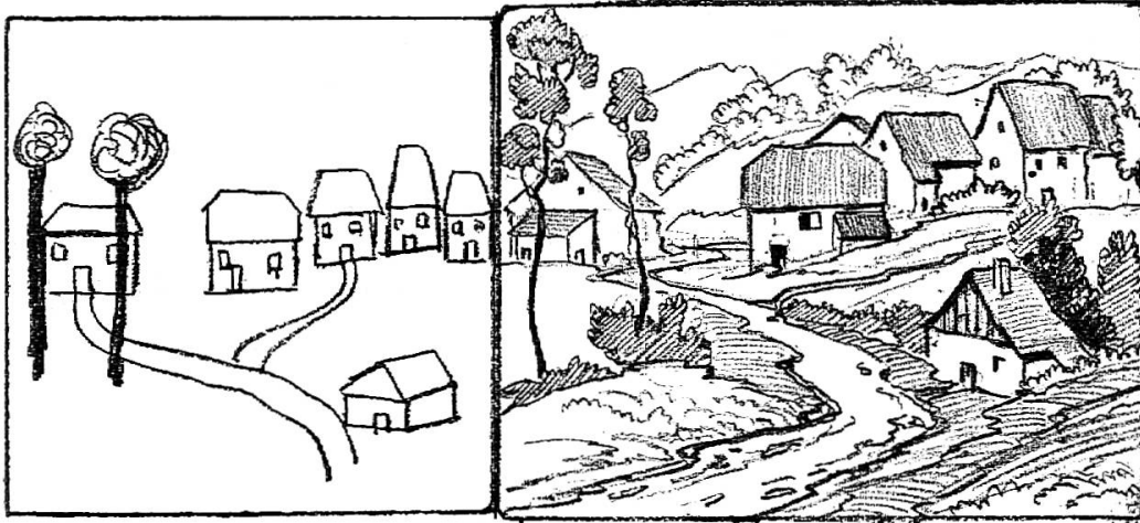
Fig. 267. — Dessin d'élève.