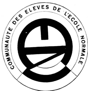
Fig. 3. L'insigne de la communauté. Sa création a été décidée en assemblée générale; celle-ci a chargé l'actuelle seconde classe d'élaborer les projets. L'insigne adopté a été retenu, à la majorité, sur trois propositions.

L'activité d'un tel groupement créera, on le voit, un double courant d'information entre l'instituteur aux prises avec les difficultés pratiques de l'enseignement et l'École, qui ne peut se passer des informations de ce dernier, si elle veut œuvrer à même la vie, et à même l'expérience pédagogique qui se déroule jour après jour, dans nos classes primaires. L'École, de son côté, pourra mettre à la disposition des membres de l'Amicale, selon une convention à arrêter, ses bibliothèques, ses ateliers, et certains moyens d'enseignement, dont ceux contenus dans sa nouvelle bibliothèque de méthodologie, création récente, précisément, de la communauté.