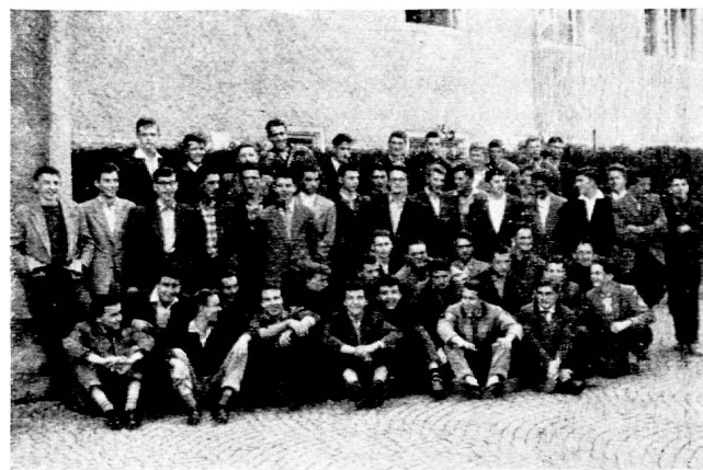
Fig. 2. Communauté des élèves de l'Ecole normale. L'ensemble des élèves constitue l'Assemblée générale, autorité suprême de la communauté. Les décisions y sont prises à la majorité des deux tiers. Les votations importantes se font à l'urne. Tous les élèves jouissent des mêmes droits et sont astreints aux mêmes devoirs communautaires.

En outre, cette Amicale pourra recueillir les suggestions, les vœux et propositions de ses membres quant à l'Ecole normale et les transmettre à qui de droit par le directeur de l'Ecole normale.