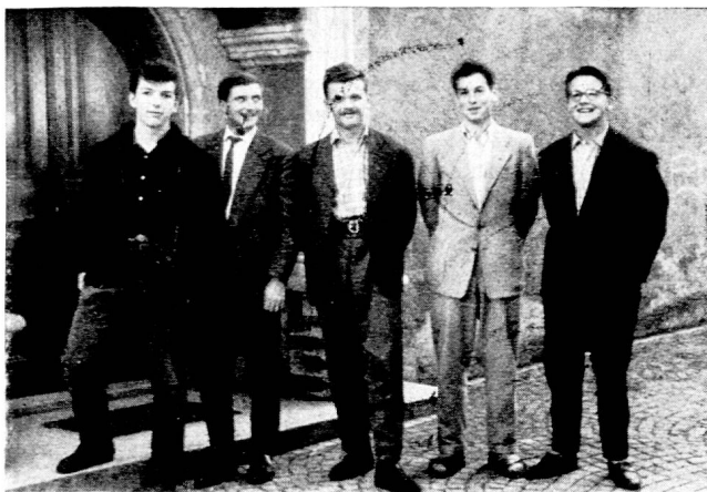
Fig. 1. Communauté des élèves de l'Ecole normale. Les cinq premiers présidents. La communauté « consomme » beaucoup de présidents ; cette charge ne doit pas aboutir à créer un sous-directeur. Aussi le président est-il remercié à chaque Assemblée générale pour les services rendus. Il est néanmoins rééligible.

ses termes par l'Assemblée générale de la communauté, de quel esprit s'inspire la nouvelle organisation. La part que nous avons prise, personnellement, à la rédaction de la constitution, est des plus réduites ; nous avons assisté à une séance de Conseil général (provisoire) pour y délimiter les secteurs pouvant être confiés au discernement des élèves et éviter ainsi tout chevauchement sur nos prescriptions réglementaires. Puis... nous avons brûlé l'estrade, pour nous servir de l'expression de C. Freinet, et ce fut à été pour nous feu de joie : ah ! que l'estrade flambait bien ! Car, à vrai dire, le système reposant sur la discipline hétéronome, même assoupli, par lequel nous avons dirigé l'Ecole jusqu'à ce jour, ne nous avait jamais donné pleine satisfaction. Aussi avons-nous peu à peu, au cours des ans, préparé le terrain à un changement de la conception même de la conduite de notre séminaire, et cela par une évolution confiante vers les méthodes de culture morale actives. L'éclosion de notre communauté est donc un aboutissement, et non un point de départ nouveau plus ou moins imposé. « Le point de rencontre, nous écrit C. Freinet après avoir pris connaissance de cette innovation, dans la clairière, de toutes les pistes où nous sommes laborieusement engagés pour aller vers un peu plus de lumière, un peu plus de civisme, une plus grande liberté dans la dignité du devoir accompli. »