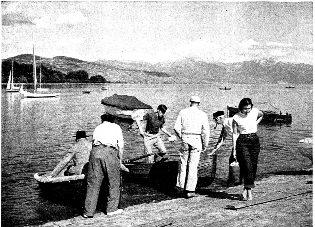
Sur les bords du Léman