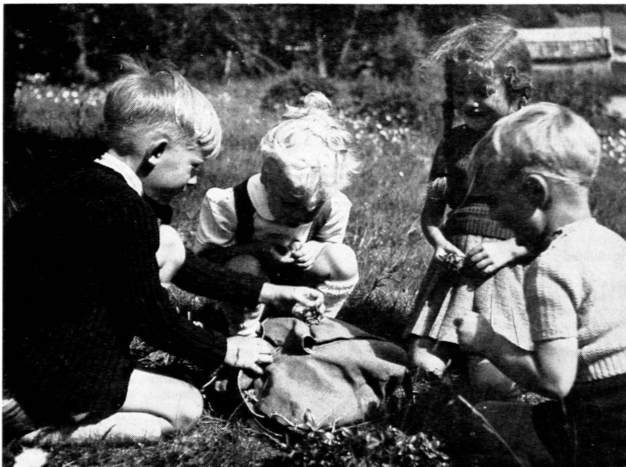
Le plus beau moment de la course...

Rédacteurs responsables: Educateur, J.-P. ROCHAT, Direction des écoles primaires, Montreux, Bulletin, G. WILLEMIN, Case postale 3, Genève-Cornavin. Administration, abonnements et annonces: IMPRIMERIE CORBAZ S.A., Montreux, place du Marché 7, téléphone 6 27 98. Chèques postaux II b 379 PRIX DE L'ABONNEMENT ANNUEL: SUISSE FR. 20.- ; ÉTRANGER FR. 24.- • SUPPLÉMENT TRIMESTRIEL: BULLETIN BIBLIOGRAPHIQUE