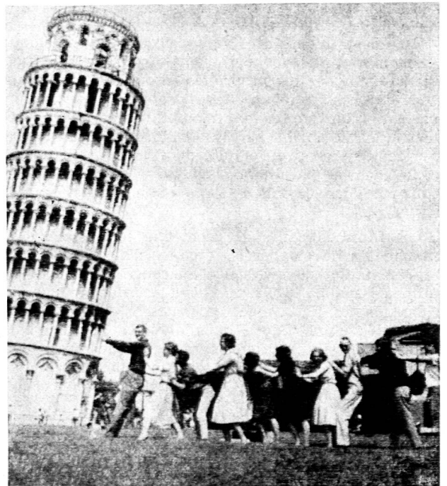
Tout dépend du point de vue où l'on se place...

Il exigera d'autre part la mise à la disposition des écoles des copies de films, dont le prix devra être peu élevé. Chaque école pourrait se constituer ainsi, sans grande dépense, une petite collection de films essentiels qui se développerait d'année en année et qui