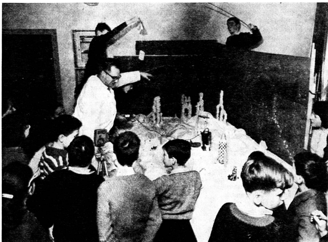
L'éducation au cinéma comporte aussi le désamorçage d'un certain envoûtement, par l'initiation pratique aux trucs et autres mystifications du 7e art. Ici, une classe est en train de tourner un sketch de son cru: « Voyage à la lune ».

Cet enseignement doit constituer pour chaque enfant une étude systématique et figurer dans les programmes scolaires. Nous sommes pleinement conscients des diffi-