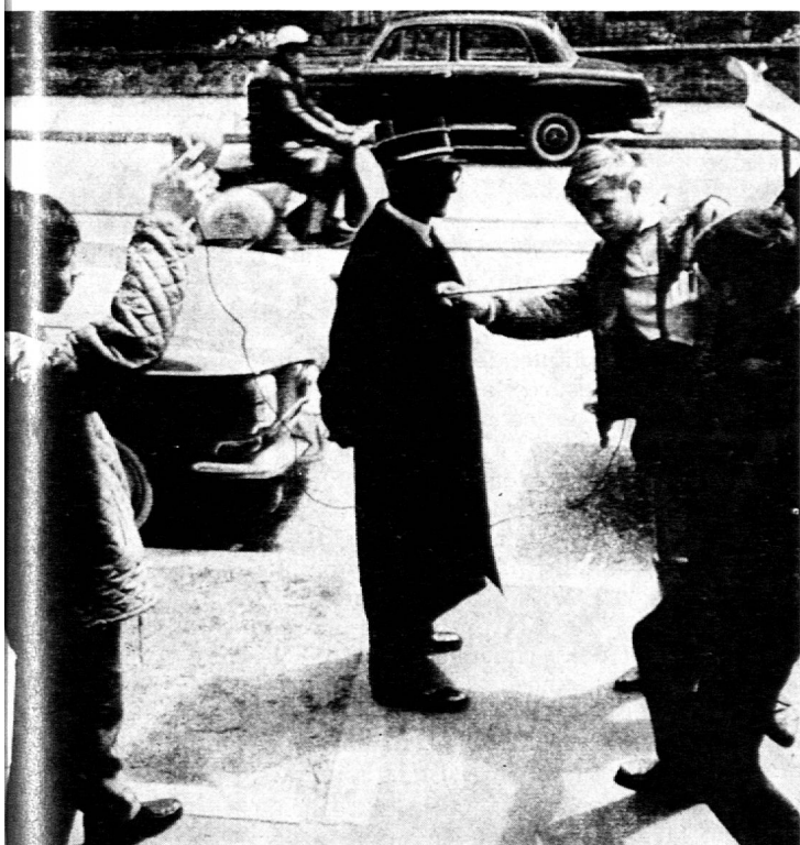
Travail en équipe : technique de la prise de vue.