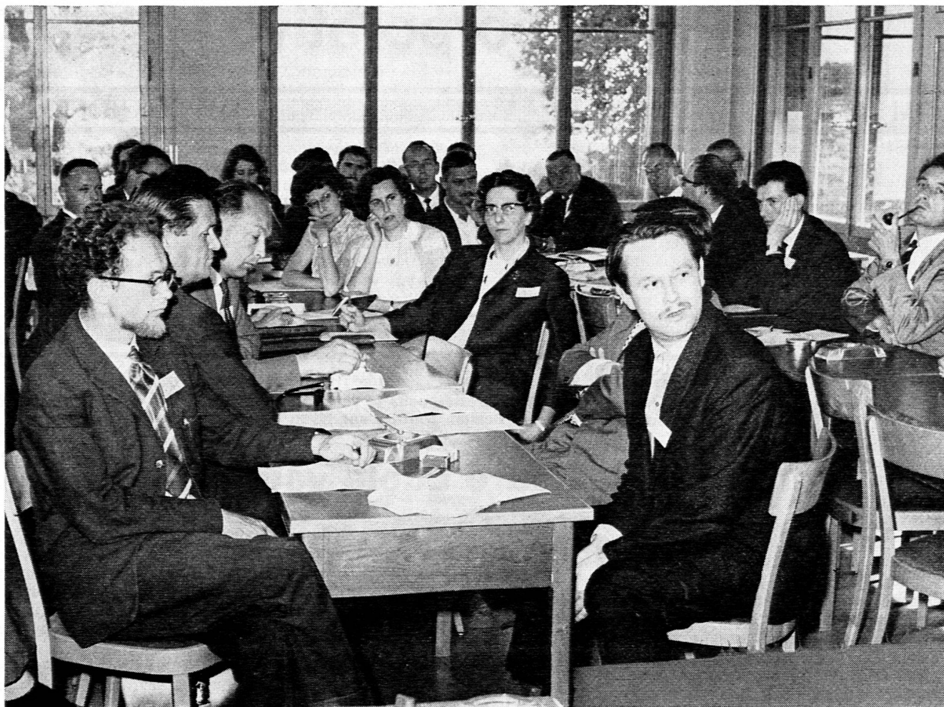
Du travail sérieux...

Les élèves étrangers ne sont pas nécessairement les plus mauvais, au contraire.