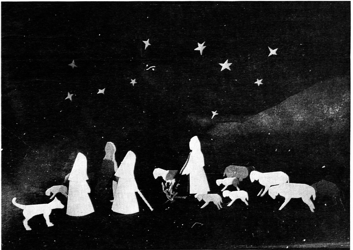
Bergers et moutons, pliage pour Noël