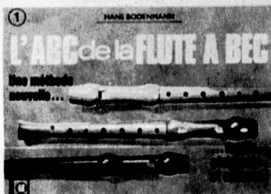
L'ABC de la FLÛTE A BEC vol. 1 + 2

Das hervor- ragende Lehrmittel für die Grundschule unter Einbe- ziehung des Orff'schen Instrumentariums.