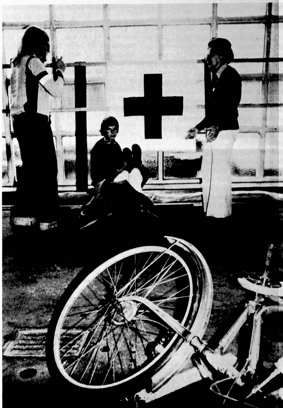
Tournoi national de premiers secours pour écoliers à Wabern. — Que faire lorsqu'un camarade se blesse lors d'une chute à vélo ?

La Commission d'achats (CA-SPV) a quelque peu souffert du profond renouvellement au sein du Comité cantonal SPV. Elle s'est néanmoins reconstituée au début de l'année sous la présidence du