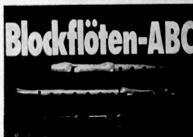
Blockflöten-ABC Band 1 + 2