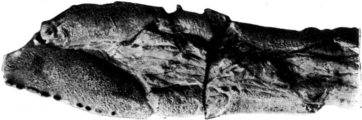
Hoploparia dentata A. Roemer; vollständigstes Exemplar von Ihme bei Hannover.

Die Länge des grösseren Scherenfusses ist in Ergänzung der fehlenden Scherenfinger auf etwa 14 cm bei 5 cm Länge