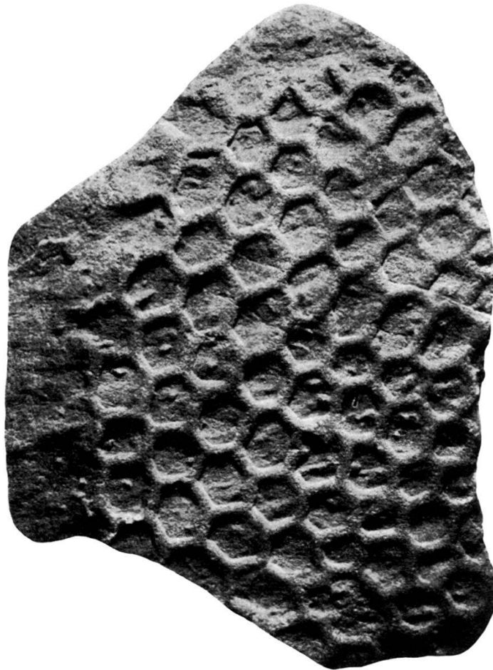
Fig. 1. Palaeodictyon seranense n. sp. Norischer Flysch, Bula-Gebiet, Ost-Seran. Nat. Gr.

Bemerkungen: P. seranense n. sp. hat grosse Ähnlichkeit mit P. regulare SACCO, insbesondere mit dem im folgenden beschriebenen Exemplaren des Zlam-