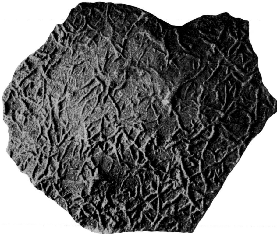
Fig. 3. Chondrites gonidioides n. sp. Norischer Flysch, Bula-Gebiet, Ost-Seran. Nat. Gr.

Auf diese Weise kann man sich auch die vorliegenden Gebilde entstanden denken. Der Gedanke an irgendwelche Gewächse, wie Algen, liegt hier trotz der gewächsartigen Verzweigung völlig fern. Denn diese Gebilde bestehen, wie gesagt, aus dem gleichen Material wie das übrige Gestein; sie heben sich von den letzteren nicht einmal durch eine andersartige Färbung, sondern lediglich durch ihre Körperlichkeit ab und sind zweifellos spätere Ausfüllungen von vorhergebildeten Hohlräumen mit Sediment.