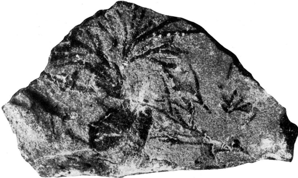
Fig. 4. Chondrites sp. Norischer Flysch, Bula-Gebiet, Ost-Seran. Nat. Gr.

Beschreibung: Die Gesteinsplatte zeigt auf einer Schichtfläche dichotomisch ziemlich reich verästelte Chondriten. Die Äste besitzen einen Durchmesser von 1–2 mm, unterscheiden sich von dem angrenzenden hellgrauen Gestein durch eine etwas dunklere Färbung, jedoch tritt der Gegensatz in der Färbung auf dem Originalstück lange nicht so deutlich heraus wie in der Photographie. Die Erhaltung ist schlecht, so dass von einem Vergleich mit anderen Chondriten und einer Benennung abgesehen werden kann.