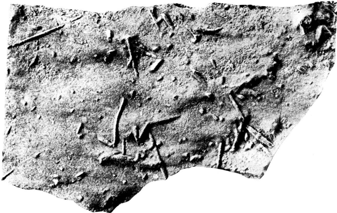
Fig. 5. Bauten tubikoler Anneliden. Norischer Flysch. Bula-Gebiet, Ost-Seran. Nat. Gr.

Sediment Röhrrchen aufgebaut. Die Röhrrchen besitzen im vorliegenden Falle die gleiche Färbung und bestehen, soweit man das mit der Lupe feststellen kann, aus dem gleichen Material wie das übrige Gestein. Sie sind von den Annelidenbauten von Terebellina (? mackayi BATHER), die aus der Trias von West-Seran und Misol bekannt geworden sind (WANNER, Lit. 50, S. 163, JAWORSKI, Lit. 19, S. 139), durch den geringeren Durchmesser und das Fehlen einer medianen Furche deutlich verschieden.