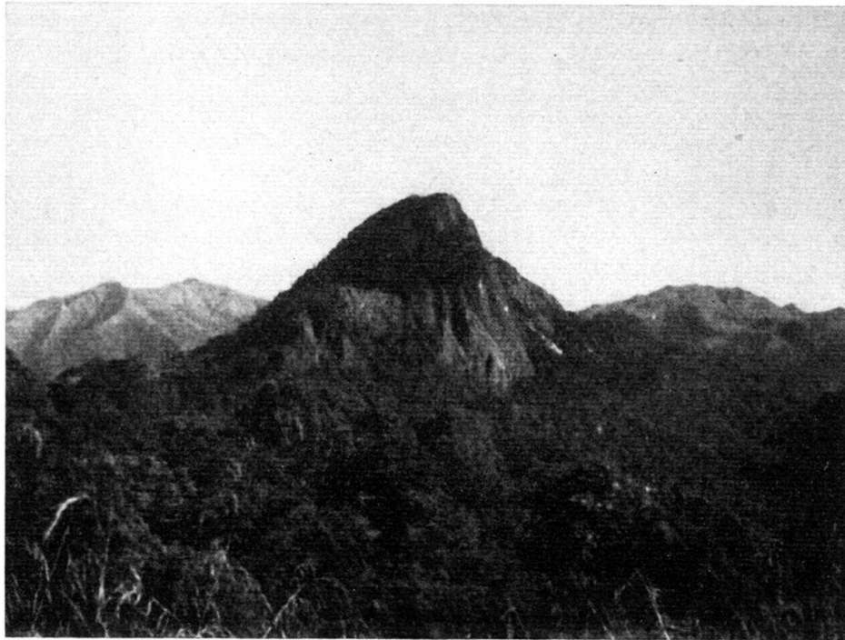
Fig. 3. Die aus massivem Fatukalk unbestimmten Alters bestehende Gipfelpyramide des Foho Fehu bei Pualaca. Im Hintergrund praepermische kristalline Schiefer.

zeitlich zu gliedern durch Foraminiferen, die von oberkretazischen Globotruncanen bis zu oberoligozänen Spiroclypei (leitend für Tertiär e) reichen. Es kann angenommen werden, dass diese oberkretazisch-alttertiären Fatukalke eine primäre Mächtigkeit bis zu 1000 m aufweisen.