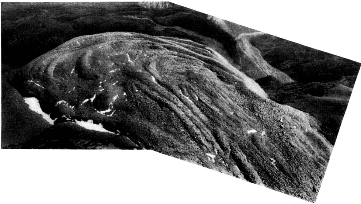
Sommer 1953

Im SE von Cuolmen d'Fenga im steilen Tälchen nordwestlich Piz Valpiglia und Piz Mottana; südlich Cuolmen d'Fenga; in Vesil (Tirol) nordwestlich Piz Roz als mächtiger, im Frontabschnitt in drei Zungen gespaltener Blockstrom; südöstlich Zebblasjoch, in den zweischneidigen Nordgrat des Piz Roz eingebettet; NNE Piz Roz auf Chavrà, oberstes Samnaun; in Val Gravas; schlecht erhaltener Schuttstrom in der obersten Val Bolchèras auf der Nordwestseite des Stammerspitzes.