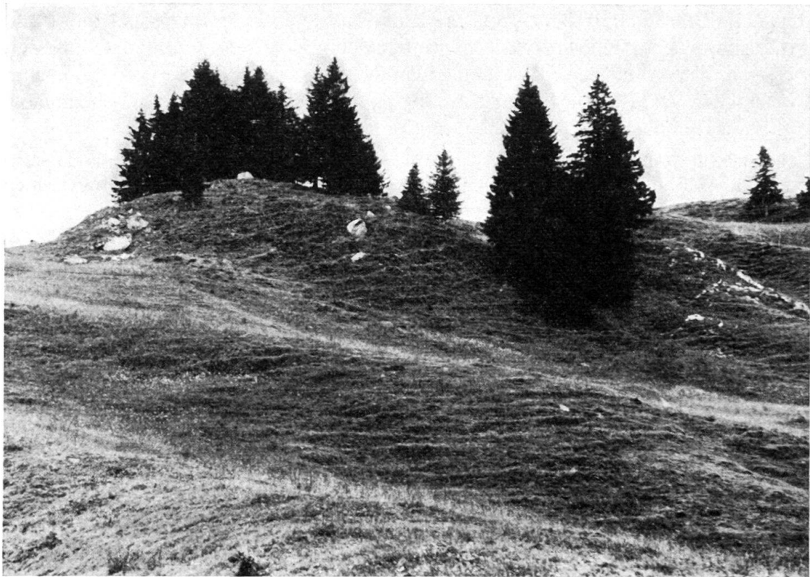
Fig. 3. Einschlüsse der Schörizegg.

In den Flysch eingesedimentierte Einschlüsse treten auf Schörizegg in einem Areal auf, das etwa 150 m lang und 100 m breit ist. Es sind zwei kleine Hügelzüge mit einförmiger Abdachung nach S (Fig. 3). Wir können drei Zonen auseinander-