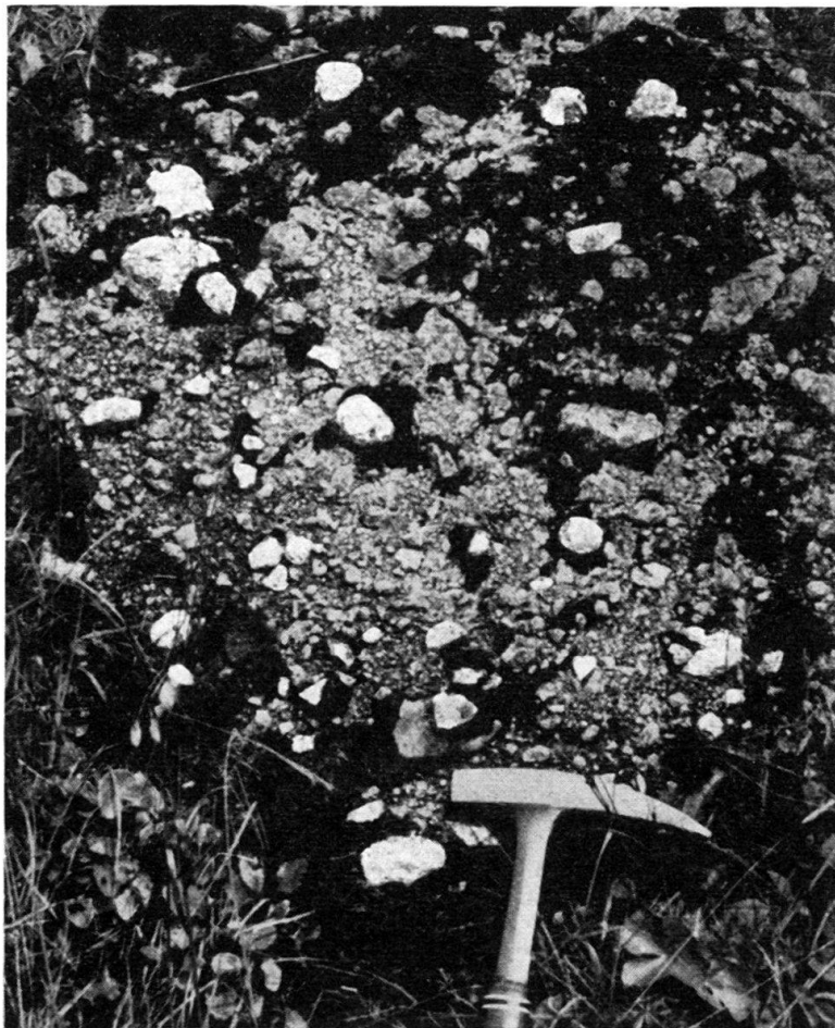
Fig. 4: Konglomerat der Schörizegg.

Die feinkrekziöse Grundmasse lässt eher vermuten, dass wir es mit einer Bildung zu tun haben, die der von SODER 1949 (pp. 79–85) aus dem Wildflysch ausführlich beschriebenen analog ist. Aus dem Bärselbach beschreibt SODER «eine etwa 16 m mächtige Serie von Brekzien mit eingestreuten faust- bis kopfgrossen Komponenten, die stellenweise zu einem echten Konglomerat zusammen-treten... Die Komponenten der Brekzien und Konglomerate sind ihrer Zusammensetzung nach zum Teil mit dem Granit des grossen Blockes identisch» (p. 80).