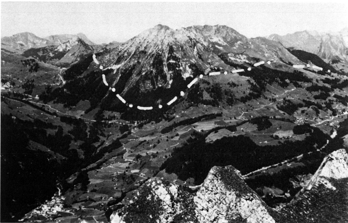
Fig. 6. L'écaille de Trias du Mont d'Or, dans les Préalpes romandes. Exemple d'une «épave» des Préalpes médianes rigides.

La simplicité apparente de cette démonstration, telle que nous la présentons ici en regroupant des éléments disséminés au long du texte de LUGEON & GAGNEBIN, ne doit pas faire croire que les choses sont en réalité si faciles. Déjà la détermination de la géométrie actuelle pose toutes les difficultés inhérentes au passage d'observations de surface à une reconstitution de volumes. La séparation tectonique des Rigides fut d'abord proposée par JACCARD (1908) dans la région Rubli-Gummfluh, puis refusée par des auteurs qui rétablirent la liaison souterraine; réhabilitée avec des arguments détaillés par LUGEON & GAGNEBIN (1941), qui l'étendirent à toutes les Préalpes romandes, cette conception fut de nouveau contestée dans les années 60; finalement, elle est pleinement rétablie et développée par les analyses stratigraphiques minutieuses de BAUD (1972), et étendue aux Préalpes du Chablais par SEPTFONTAINE & LOMBARD (1976).