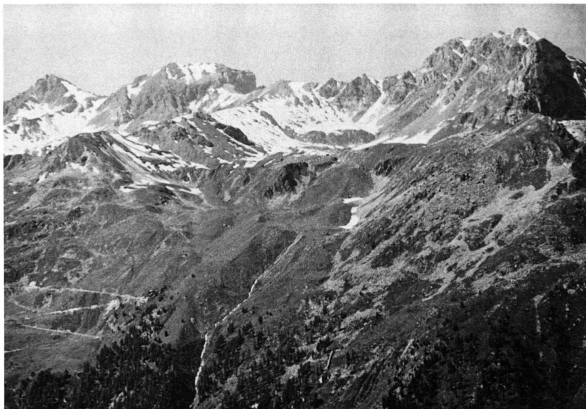
Fig. 2. Vue vers l'W de la partie centrale du terrain étudié. Du N (à droite) au S: la Pointe de Tourtemagne, l'arête du Wyssgrat enneigée, le Boudri et la Pointe de Forcletta.

Un secteur de cette crête allongée N-S, qui va du Meidpass au Frilihorn, a été l'objet d'une cartographie au 1:2500 très détaillée. Ses principaux sommets sont: la Pointe de Tourtemagne, flanquée à l'W du Toûno et à l'E du Meidhorn, au S le Roc de Boudri (ou simplement le Boudri) et la Pointe de Forcletta.