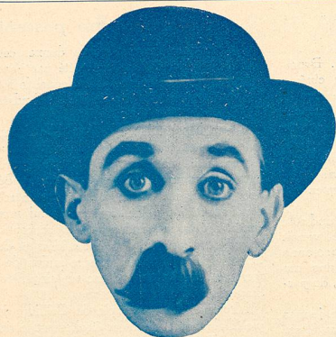
CLYDE COOK dit DUDULE