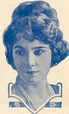
LÉATRICE JOY IN PARAMOUNT PICTURES

Ce ne fut que le lendemain, en voyant mon portrait et ma biographie dans les journaux que je sus que j'appartenais à la "Compagnie de Nola".