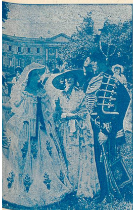
Une scène de Violettes impériales.