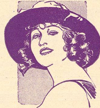
Betty Compson in the Paramount Picture The White Flower

Née au bord du lac Salé, Betty, pour augmenter les maigres ressources de sa famille, jouait du violon dans un petit théâtre. Un soir, une attraction manqua, le directeur à court de programme demanda à Betty de jouer un solo de violon.