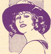
Betty Compson in the Paramount Picture The White Flower

Née au bord du lac Salé, Betty, pour augmenter les maigres ressources de sa famille, jouait du violon dans un petit théâtre. Un soir, une attraction manqua, le directeur à court de programme demanda à Betty de jouer un solo de violon.