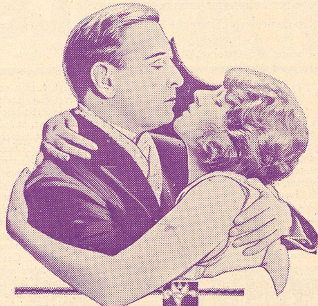
Corinne Griffith and Conway Tearle in "Lilies of the Field"

LA MEILLEURE PELLICULE NÉGATIVE ASTRA POSTIVE LA MOINS CHÈRE M. SAUTY & C e , GENÈVE 58, Rue de Carouge, 58