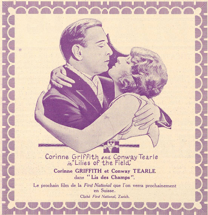
Corinne Griffith and Conway Tearle in "Lilies of the Field"

LA MEILLEURE PELLICULE NÉGATIVE ASTRA POSTIVE LA MOINS CHÈRE M. SAUTY & C e , GENÈVE 58, Rue de Carouge, 58