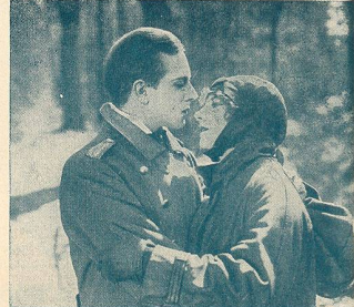
Jaque Catelain et Huguette Duflos