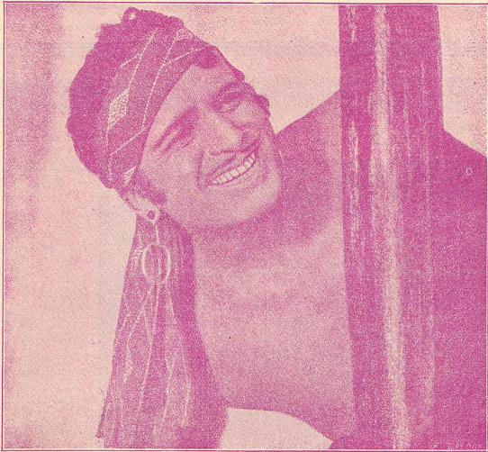
DOUG, L'HOMME DU JOUR Le sourire inoubliable de Ahmed, le Voleur de Bagdad

ADMINISTRATION et RÉGIE DES ANNONCES : 5, Rue de Genève, 5, LAUSANNE — Téléphone 82.77 ABONNEMENT : Suisse, 8 fr. par an ; Etranger, 13 fr. :: Chèque postal N° II.1028 RÉDACTION : L. FRANÇON, 22, Av. Bergières, LAUSANNE :: Téléphone 35.13