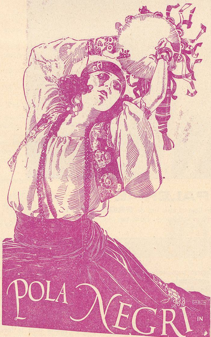
dans LA DANSEUSE ESPAGNOLE interprète le principal rôle de Maritana une Tzigane qui passe intrépide à travers tous les dangers pour sauver son bien-aimé.

qui interprète le rôle de LA DANSEUSE ESPAGNOLE