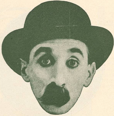
CLYDE COOK dit DUDULE