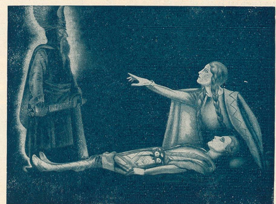
Une scène du film „Les Nibelungen“. Kriemhilde reconnaît Hagen comme le meurtrier de Siegfried.