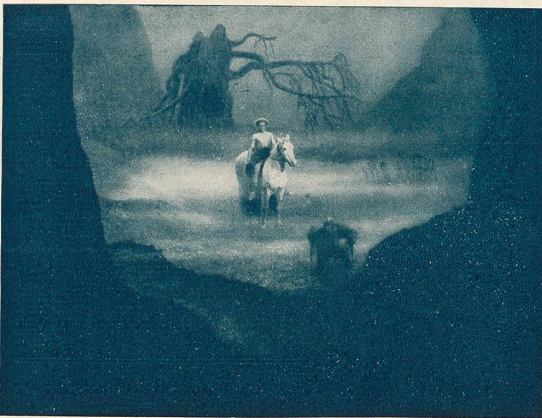
Une scène du film „Les Nibelungen“. Siegfried dans le royaume du Kobold Alberich.