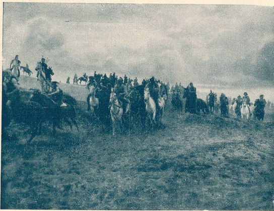
Une scène du film „Les Nibelungen“. Troupe des Huns traversant le pays des Goths.