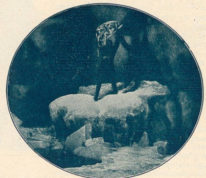
Scène du film „Les Nibelungen“. Hagen jette le trésor des Nibelungen.

Rien n'égale en sauvage grandeur la conception de la farouche épopée. D'autres ont des accents plus purs, des élans plus lyriques, une variété plus séduisante ; aucune n'atteint à cette continuité d'énergie, n'accumule autant de drames terribles, ne retentit à ce point de l'invective des combattants et du fracas de leurs armes. On sent que l'auteur anonyme du poème a recueilli