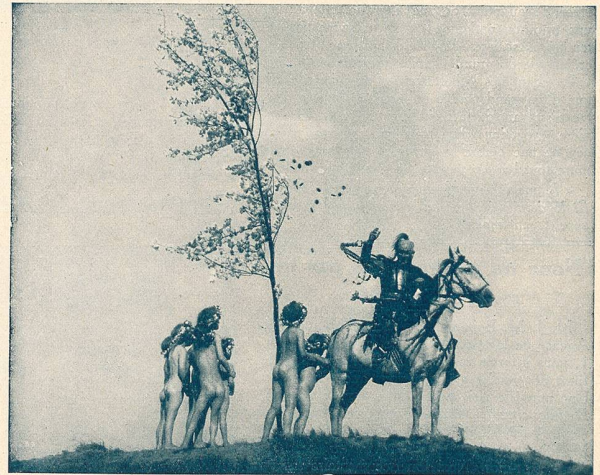
Scène du film „Les Nibelungen“. Etzel, roi des Huns, dans sa joie paternelle, jette des pièces d'or.