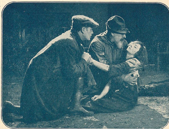
Le chatelain et Aubert le piqueur, qui aimait secrètement Marielle, surviennent et la trouvent presque privée de raison, hébété devant le cadavre du misérable qu'elle aimait.