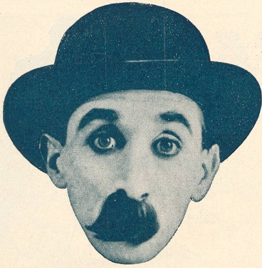
CLYDE COOK dit DUDULE