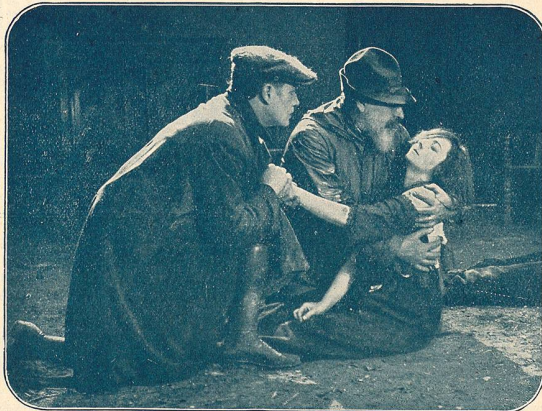
Le chatelain et Aubert le piqueur, qui aimait secrètement Marielle, surviennent et la trouvent presque privée de raison, hébété devant le cadavre du misérable qu'elle aimait.