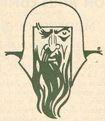
HAGEN DE TRONEJE

La première partie de l'œuvre a pour titre « Siegfried » ; elle décrit la vie et les aventures de ce prodigieux héros, comment il forgea la fameuse épée Balmung et tua le Dragon ;