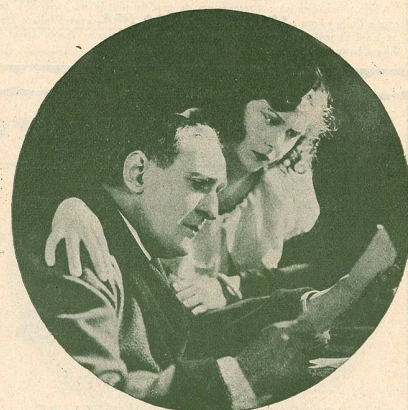
Une scène de L'ARRIVISTE