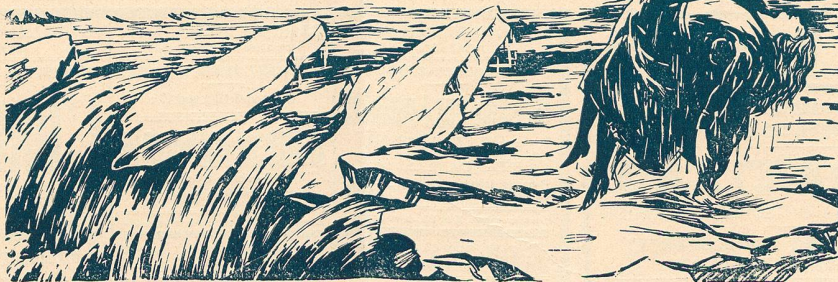
Way down East ! A travers l'orage ! Le merveilleux film de Griffith !... au Cinéma du Bourg.

Or, ce qu'il y aura de plus extraordinaire en cette aventure, c'est que tous les membres de cette famille qui étaient jadis le plus hostiles au cinéma vont tous y travailler assidûment et même y faire fortune, tandis qu'Angèle ne tournera pas une seule fois ! Mais elle aura tout de même de la chance puisqu'elle finit par épouser son fidèle fiancé, Lem Lefferts, devenu l'émule de William Hart, avec de brillants cachets !