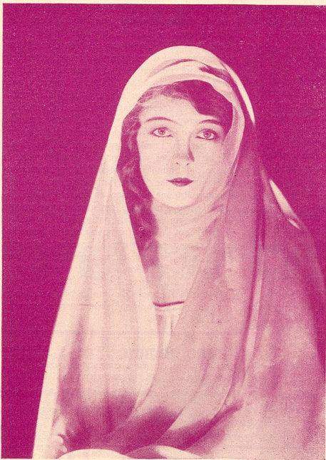
LILIAN GISH dans «La Sœur Blanche»

Son succès fut retentissant. Dans cette œuvre, comme dans tout son théâtre, l'auteur porte à la scène un sujet qui prête aux discussions philoso-