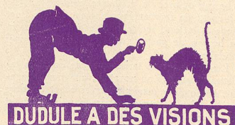
DUDULE A DES VISIONS

En vous abonnant à L'ÉCRAN ILLUSTRÉ moyennant 8 fr. par an, au lieu de l'acheter chaque semaine au numéro, c'est comme si nous vous donnions Chaque Mois un numéro de „L'Écran Illustré“ GRATIS