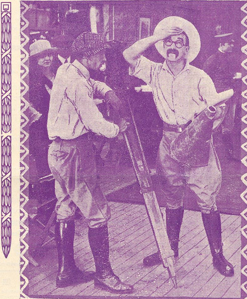
Harry POLLARD dit „Beaucitron“ met lui-même ses films en scène.

Pour suivre à de nombreuses demandes, la direction du Cinéma-Palace nous prie d'annoncer que le plus grand super-film que les Américains nous aient donné à ce jour, Le Faucon de la mer , sera projeté en février et le grand film sur la Naissance de la Confédération suisse sera donné en exclusivité au mois de janvier. Notons que Le Faucon de la Mer a été présenté en gala à l'Orient-Cinéma, à Zurich à la presse et à Messieurs les directeurs de cinéma. De leur avis, c'est la plus belle chose que l'écran révélera au public cette saison. Milton Sils, Enid Bennet et Wallace Beery l'interprètent d'une manière absolument supérieure et la mise en scène est fabuleuse.