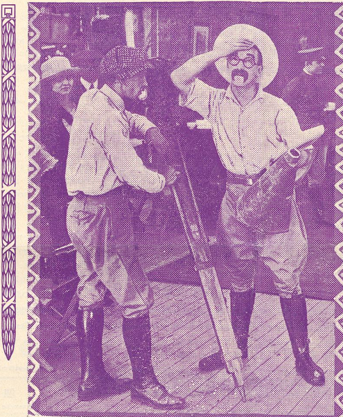
HARRY POLLARD dit „Beaucitron“ et lui-même ses films en scène.

Pour suivre à de nombreuses demandes, la direction du Cinéma-Palace nous prie d'annoncer que le plus grand super-film que les Américains nous aient donné à ce jour, Le Faucon de la mer , sera projeté en février et le grand film sur la Naissance de la Confédération suisse sera donné en exclusivité au mois de janvier. Notons que Le Faucon de la Mer a été présenté en gala à l'Orient-Cinéma, à Zurich à la presse et à Messieurs les directeurs de cinéma. De leur avis, c'est la plus belle chose que l'écran révélera au public cette saison. Milton Sils, Enid Bennet et Wallace Beery l'interprètent d'une manière absolument supérieure et la mise en scène est fabuleuse.