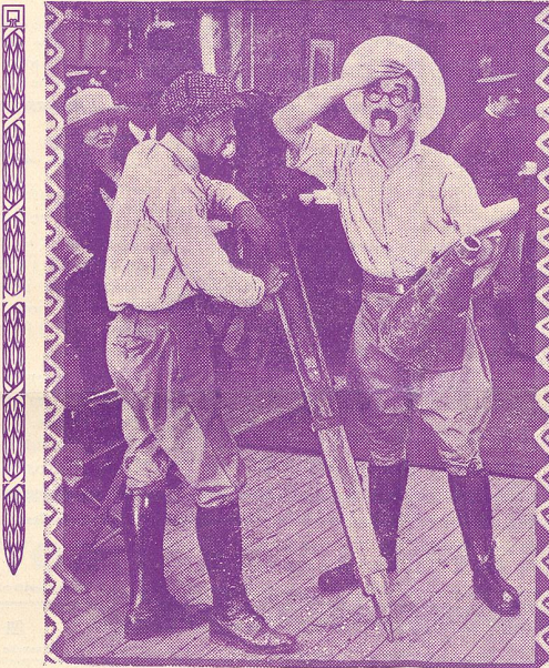
Harry POLLARD dit „Beaucitron“ met lui-même ses films en scène.

Pour suivre à de nombreuses demandes, la direction du Cinéma-Palace nous prie d'annoncer que le plus grand super-film que les Américains nous aient donné à ce jour, Le Faucon de la mer , sera projeté en février et le grand film sur la Naissance de la Confédération suisse sera donné en exclusivité au mois de janvier. Notons que Le Faucon de la Mer a été présenté en gala à l'Orient-Cinéma, à Zurich à la presse et à Messieurs les directeurs de cinéma. De leur avis, c'est la plus belle chose que l'écran révélera au public cette saison. Milton Sils, Enid Bennet et Wallace Beery l'interprètent d'une manière absolument supérieure et la mise en scène est fabuleuse.