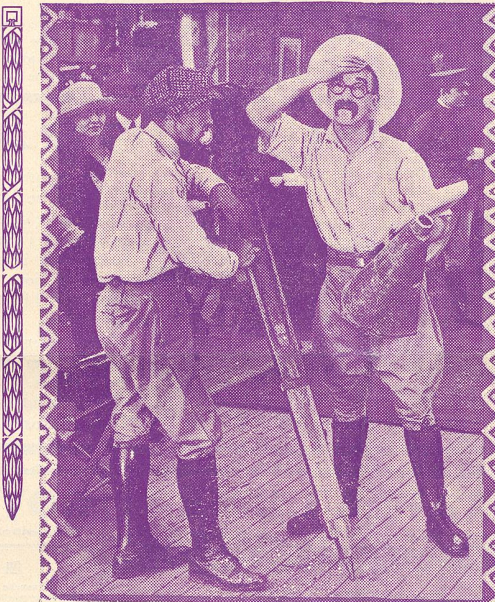
Harry POLLARD dit „Beaucitron“ met lui-même ses films en scène.

Pour suivre à de nombreuses demandes, la direction du Cinéma-Palace nous prie d'annoncer que le plus grand super-film que les Américains nous aient donné à ce jour, Le Faucon de la mer , sera projeté en février et le grand film sur la Naissance de la Confédération suisse sera donné en exclusivité au mois de janvier. Notons que Le Faucon de la Mer a été présenté en gala à l'Orient-Cinéma, à Zurich à la presse et à Messieurs les directeurs de cinéma. De leur avis, c'est la plus belle chose que l'écran révélera au public cette saison. Milton Sils, Enid Bennet et Wallace Beery l'interprètent d'une manière absolument supérieure et la mise en scène est fabuleuse.