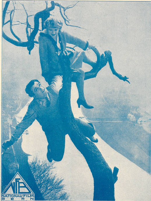
Une scène du film MISTER RADIO