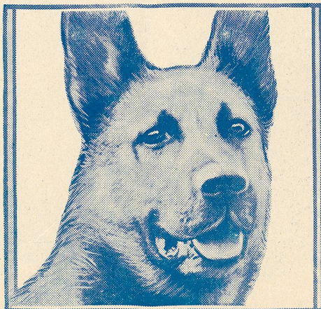
Strongheart in The Love Master