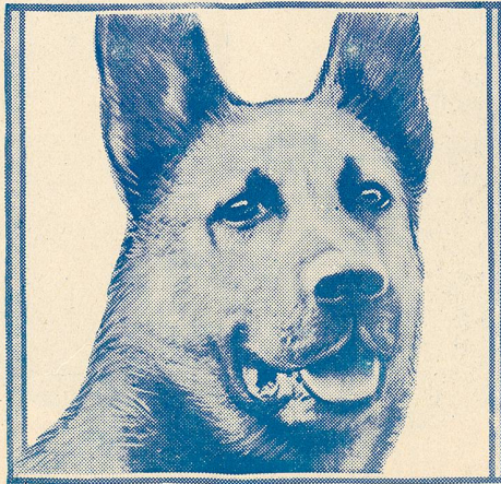
Strongheart in The Love Master