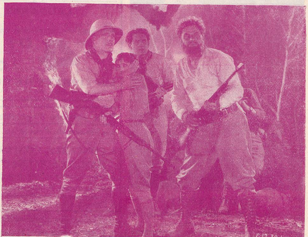
Lewis Stone, Bessie Love, Lloyd Hughes, Wallace Beery. Les chasseurs se frayent un chemin dans les forêts de l'Amazone.