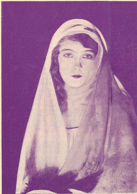
Lilian GISH dans Sœur Blanche.

Une mise en scène audacieuse et exacte entoure le drame essentiel. L'éruption du Vésuve et l'inondation d'un village, provoqué par la rupture de digues, sont des tableaux qu'on n'oubliera pas. (Cinéa-Ciné.) Ed. E.