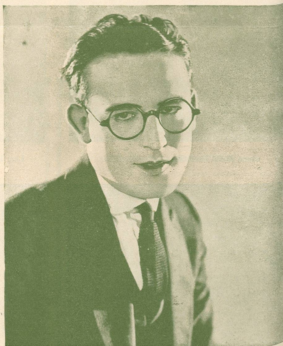
HAROLD LLOYD est cette semaine au Royal-Biograph.