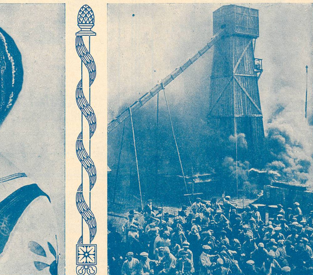
L'incendie du puit à pétrole dans La Terre promise.

Moïse Sigoulim, naguère prêteur à Scaravaloff, s'est installé changeur à Londres. Revenu au pays natal pour célébrer chez son frère, le rebb Samuel, la fête du Seder — la Pâque juive, — il y retrouve sa belle-sœur Binnah, la rabbitzine, ses nièces Esther et Lia, deux fillettes, et le fils adoptif de la famille Sigoulim, David, destiné au sacerdoce. Or, un incident banal, la chute de Lia et de David dans un champ en bordure d'une route, met Moïse Sigoulim sur la piste d'une affaire considérable de pétrole. L'odeur imprégnée dans les cheveux des deux enfants lui a révélé l'existence d'une nappe qu'il pourra exploiter grâce à un contrat préparé par lui et qui lui réserve la plus grosse part de bénéfices.