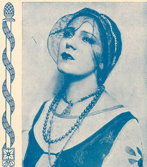
Raquel Meller dans La Terre Promise.

d'Henry ROUSSEL avec RAQUEL MELLER au Cinéma du Bourg.