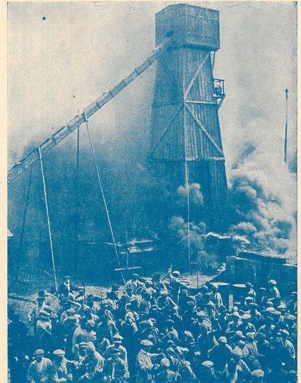
L'incendie du puit à pétrole dans La Terre promise.

La conclusion de l'œuvre s'appuie sur une très