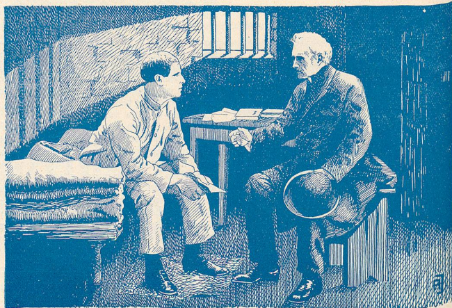
Le Charlatan ou le Martyr d'un Médecin