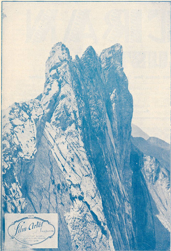
La face Solafex de l'arête de l'Argentine sur laquelle fut tourné le film.

prête absolument pas et l'on est obligé d'y remédier par la « panoramique » en hauteur.