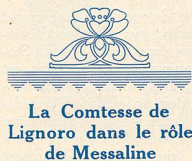
La Comtesse de Lignoro dans le rôle de Messaline

Les réalisateurs italiens peuvent seuls nous donner l'illusion de pareilles survivances qui ont toute la vraisemblance de la vérité. Ajoutez à ces cons-