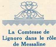
La Comtesse de Lignoro dans le rôle de Messaline

Les réalisateurs italiens peuvent seuls nous donner l'illusion de pareilles survivances qui ont toute la vraisemblance de la vérité. Ajoutez à ces cons-