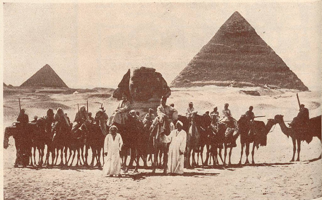
Une scène du Raid en Avion autour du Monde .

Partis de Paris, ils se sont dirigés par Marseille vers l'Égypte, ont traversé la Mer Rouge et l'Océan Indien, touchant aux régions les plus intéressantes des Indes, se transportant ensuite